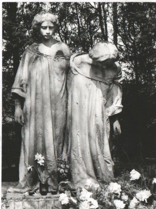
materiál: bílý mramor v = 170

5. Název (označení) památky Sousoší "Smutek"