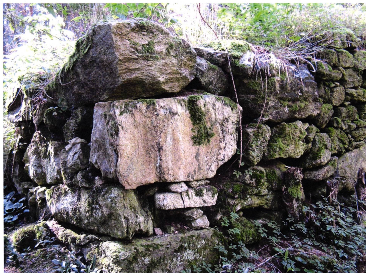
Detail severozápadního nároží šibenice zpevněného rozměrnými kvádry.