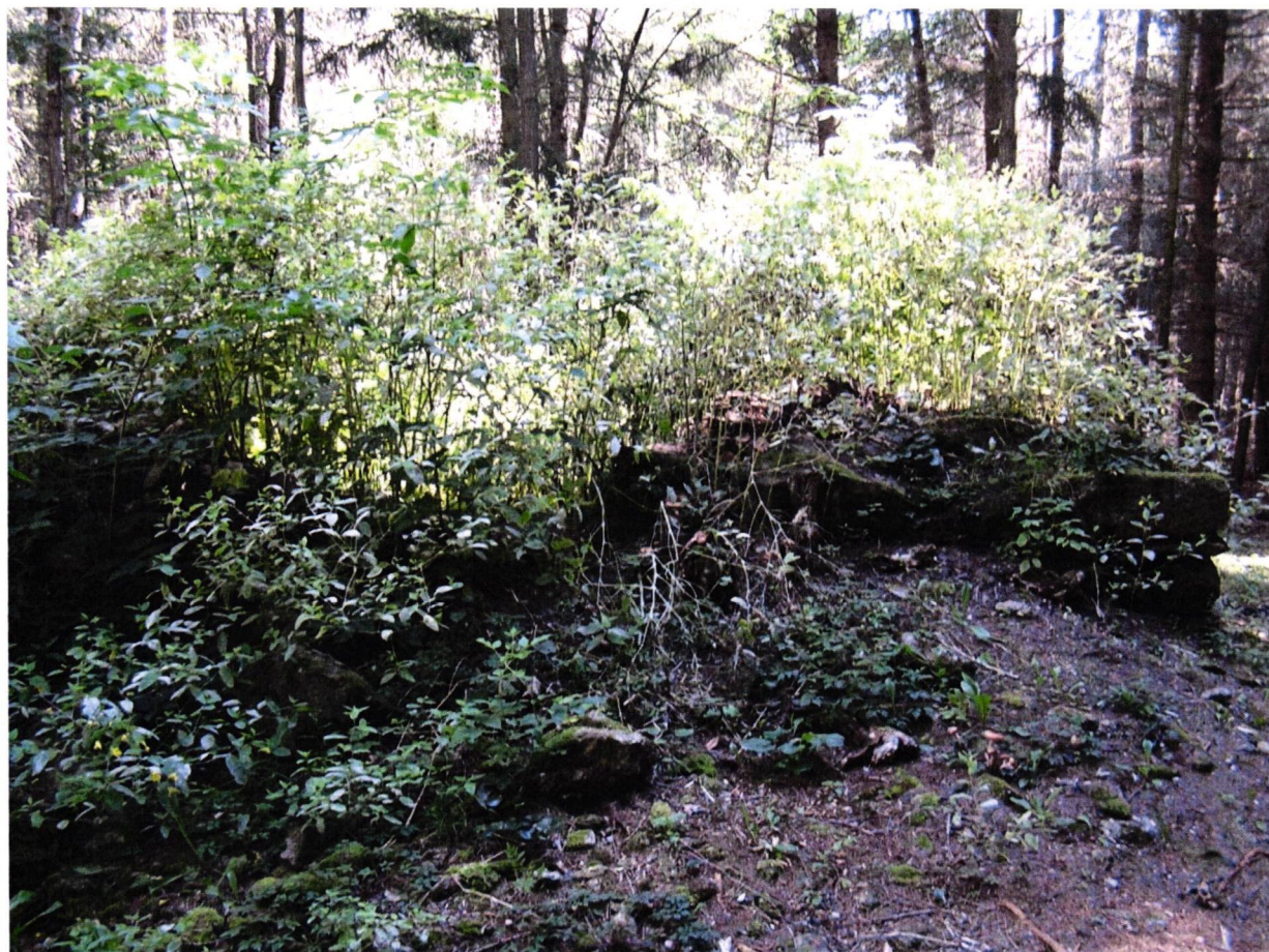
Částečně destruovaná východní stěna šibenice.