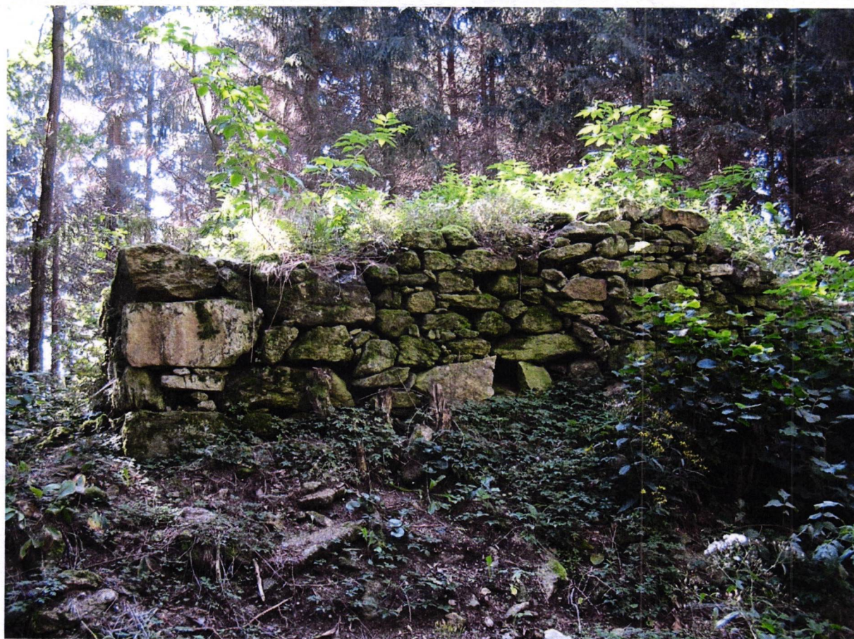
Západní stěna šibenice zachovaná do výše cca 130 cm