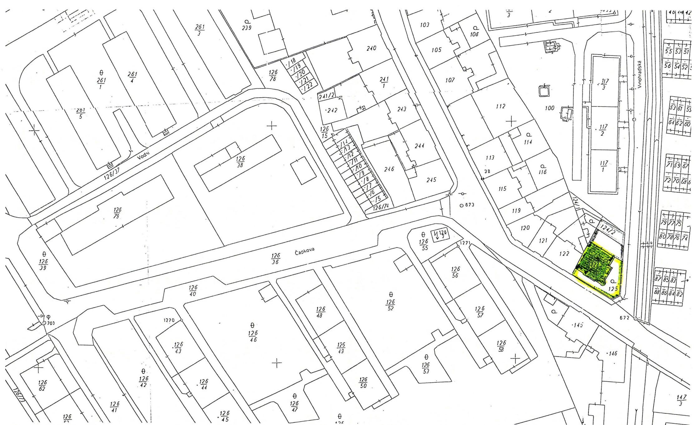
Příloha: kopie snímku katastrální mapy se zákresem umístění kulturní památky, nedílná součást rozhodnutí Ministerstva kultury č.j. 13151/2003.